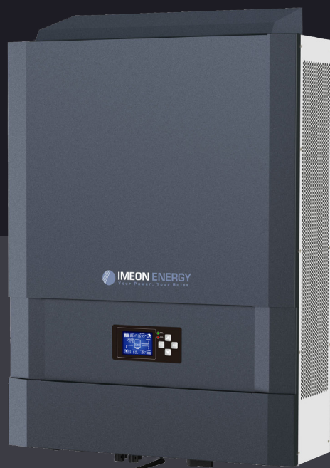
IMEON 9.12 Jusqu'à 12kWp Triphasé