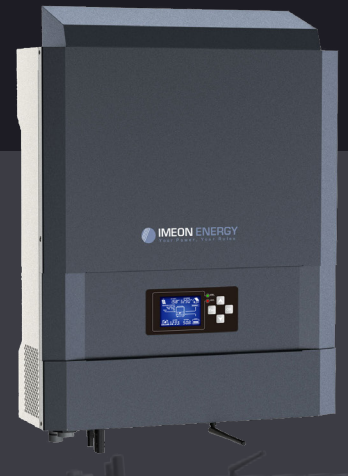
IMEON 3.6 Jusqu'à 4kWp Monophasé