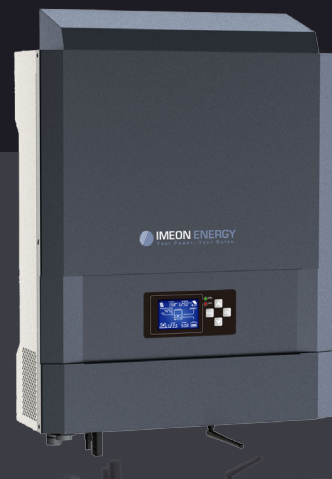
IMEON 3.6 bis zu 4kWp monphasig