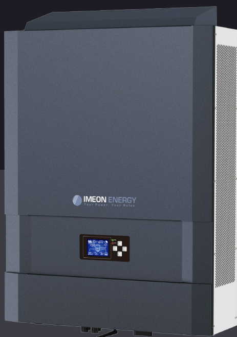
IMEON 9.12 bis zu 12kWp dreiphasig